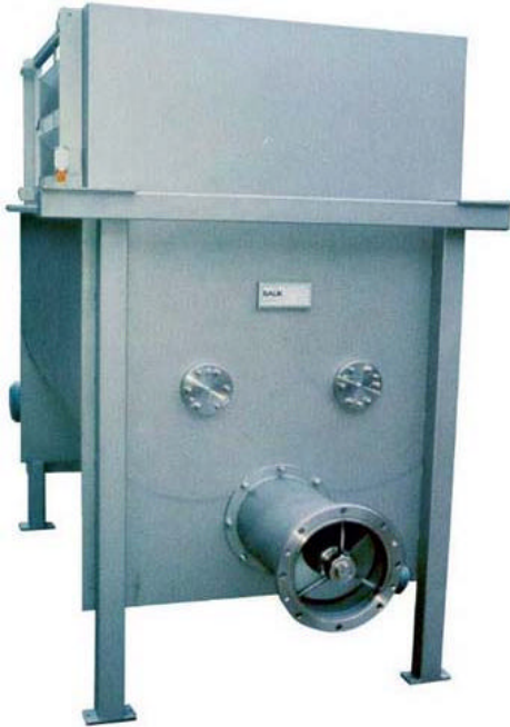
Abbildung Variate 1 Maschinenausführung mit Austragschnecke TYPE BPDM 2 WU - AS

z.B.: zur schonenden Homogenisierung von Fleischmassen